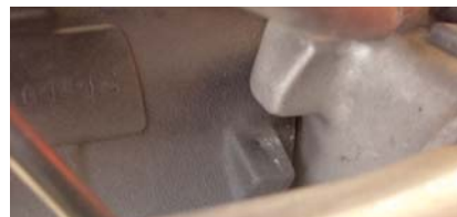
Butée de direction