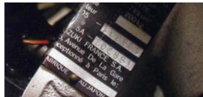
Conformité N° de série