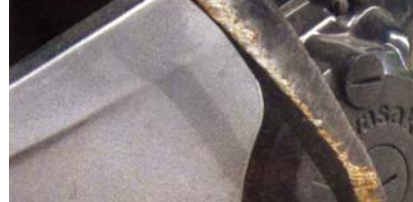
Traces de chutes